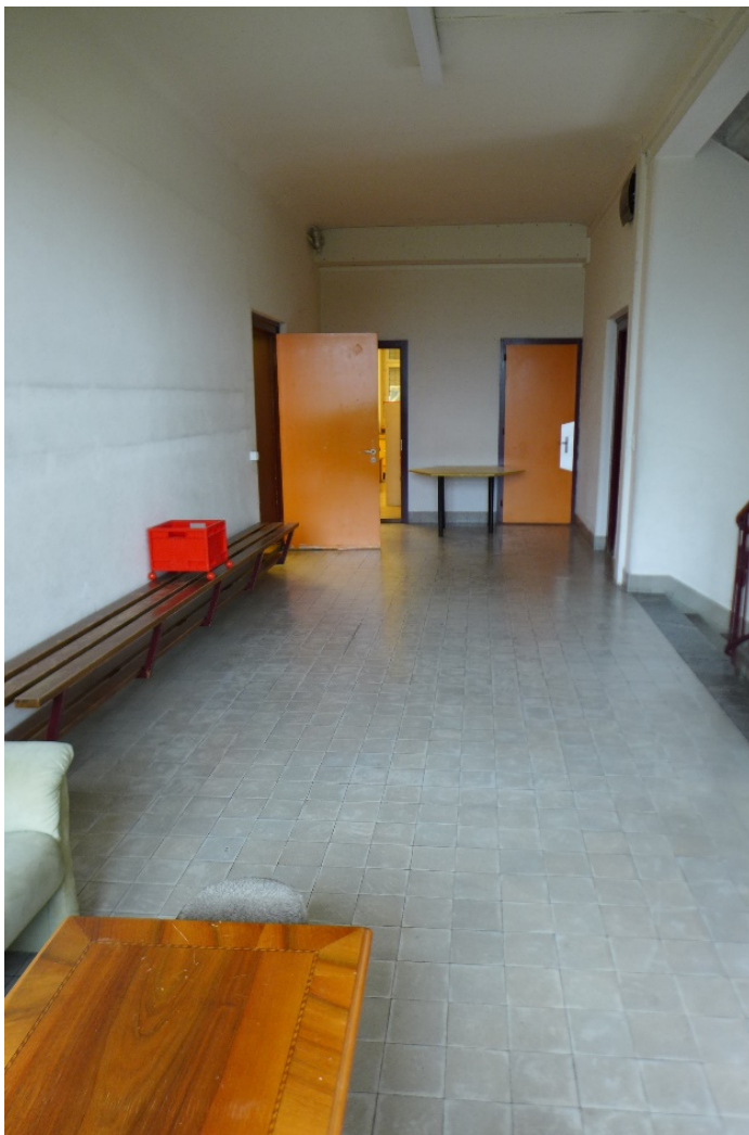
Abbildung 12 Ehem. Schulhaus, heute Gemeindehaus Niederwil. Blick in den Schulhausgang im Obergeschoss. – Im Obergeschoss ist der Schulhauscharakter noch erkennbar, wobei die Ausstattung aus den 1950er-Jahren überwiegt.

Der ursprüngliche Grundriss ist nur noch partiell und vor allem in den oberen Stockwerken wahrzunehmen (Abb. 12). Intakt erhalten ist das Treppenhaus im Südwesten des Hauses. Namentlich die Belichtung (Abb. 13) und das zeittypische, schmiedeeiserne Treppengeländer (Abb. 14) machen diesen Hausteil zum historisch wichtigsten Bereich. Beachtung verdient auch die eingetieft, ehemalige Turnhalle. Die Platzierung der Turnhalle (Abb. 15 und 16) unter den Schulzimmern, war in dieser Zeit beliebt und findet sich anderen Schulhäusern dieser Zeit, beispielsweise dem gleichzeitig nach Plänen der gleichen Architekten erbauten Schulhaus in Neuenhof oder etwa dem Schulhaus in Grellingen BL, um ein ausserkantonales Beispiel zu nennen.