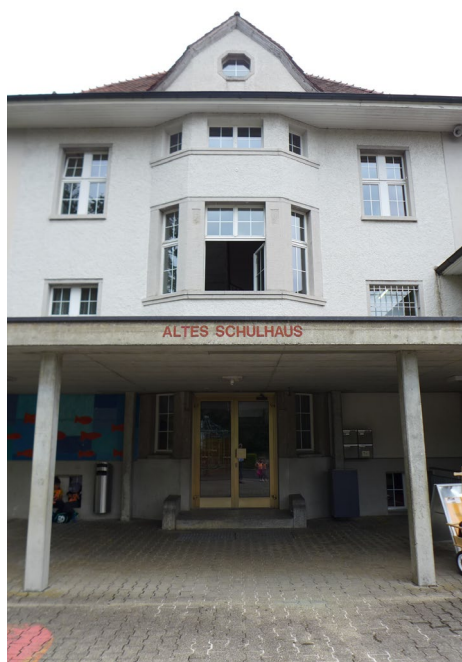
Abbildung 11 Ehem. Schulhaus, heute Gemeindehaus Niederwil. Ansicht von Westen. – Der Eingriff aus den 1970er-Jahren unterbricht die vertikale Ausrichtung des erkerartigen Treppenhauses aus der Bauzeit.