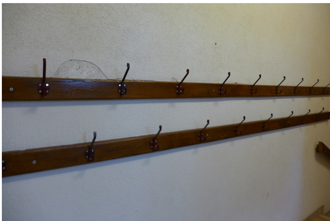
Abbildung 16 Ehem. Schulhaus, heute Gemeindehaus Niederwil. – Die vermutlich bauzeitlichen Garderobehaken im Untergeschoss zeugen von der einstigen Nutzung des Saals als Turnhalle. (Foto 28.6.2022,)