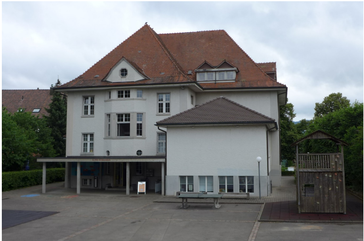
Abbildung 9 Ehem. Schulhaus, heute Gemeindehaus Niederwil. Ansicht von Westen – Der Anbau von 1949/50 schmiegt sich als weiterer Baukörper mit eigenem Vollwalmdach harmonisch an den Hauptbau.

Das hoch aufragende Vollwalmdach mit liegendem Dachstuhl nimmt gut einen Drittel des gesamten Volumens des Schulhauses ein. Der Baukörper besteht dank der fast vollständig zu Tage tretenden Turnhalle unter den Schulzimmern aus drei Geschossen. Die Fassaden sind gegliedert, wobei sich glatt verputzte rahmende Elemente wie Sockel und Lisenen mit den rau verputzten Wandflächen dazwischen abwechseln. Die grösstenteils hochrechteckigen Fenster sind paarweise angeordnet und in den Obergeschossen mit durchgehenden Fensterbänken verbunden.