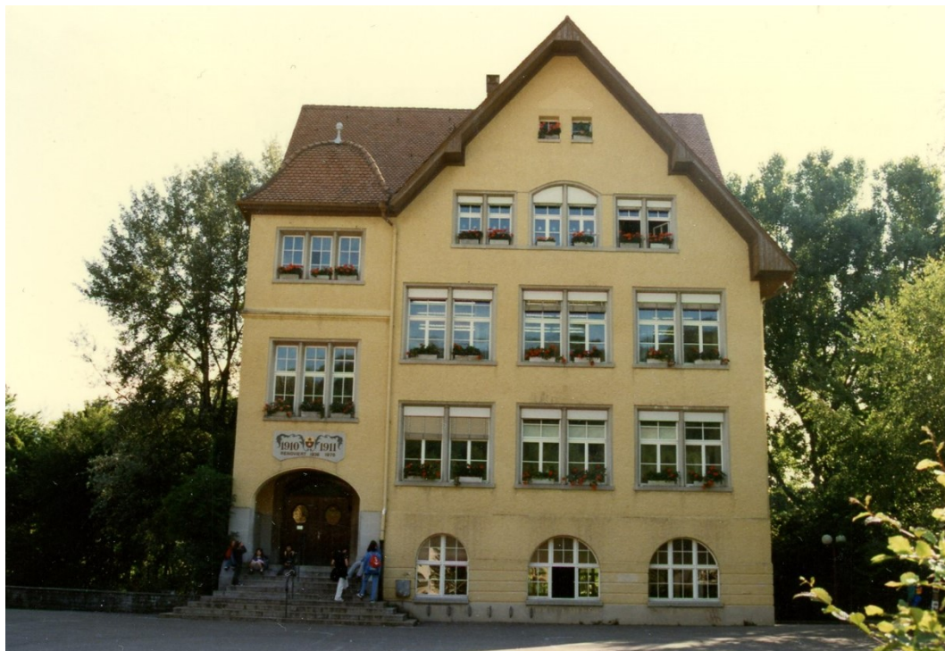
Abbildung 4 Altes Schulhaus Neuenhof. Ansicht von Südwesten (um 1997)