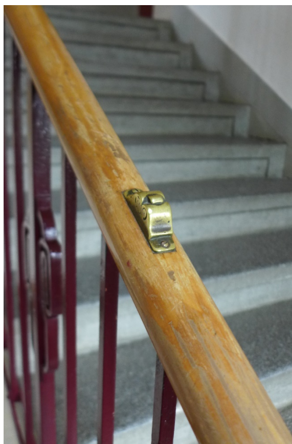
Abbildung 14 Ehem. Schulhaus, heute Gemeindehaus Niederwil. – Das schmiedeeiserne Treppengeländer im Innern zeigt bauzeitliche Details wie die stilisierten Voluten und die schmucken Messinghocker – eine baulich-erzieherische Massnahme gegen das Geländerrutschen der Schulkinder. (Foto 28.6.2022,)