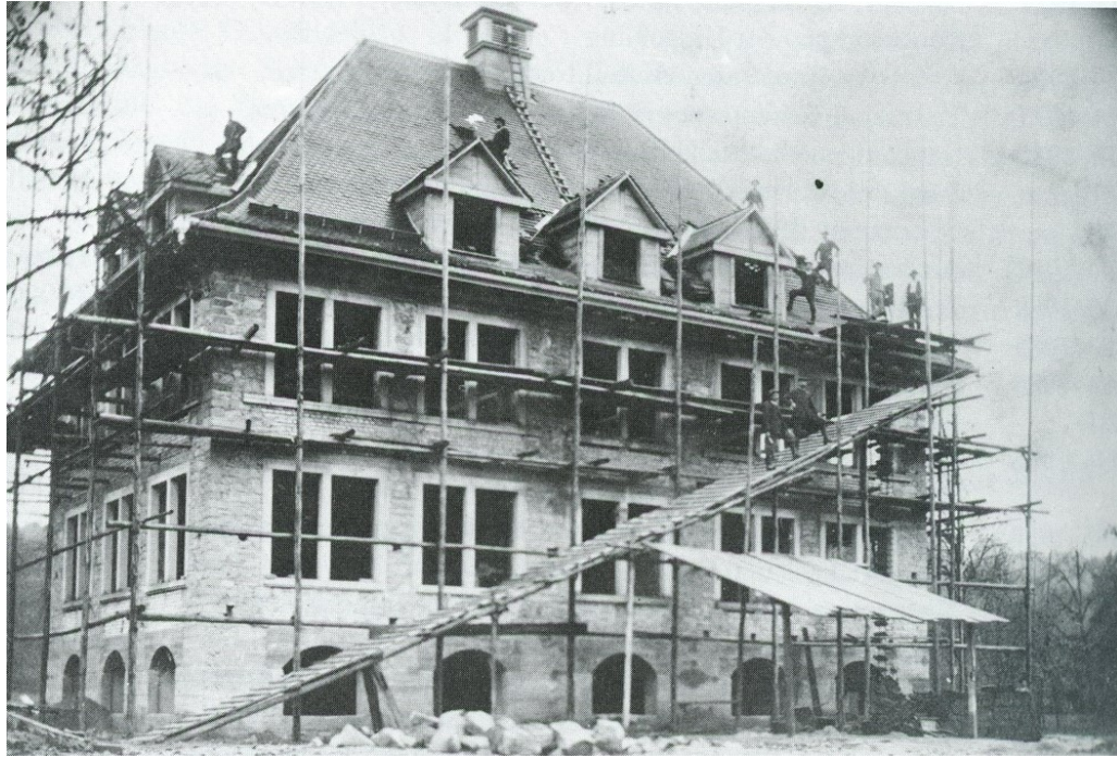
Abbildung 6 Das Schulhaus im Bau, 1911 (in: Niederwil im Freiamt. Dorfgeschichte 1993, herausgegeben von der Einwohnergemeinde Niederwil, Wohlen 1993, S. 214).