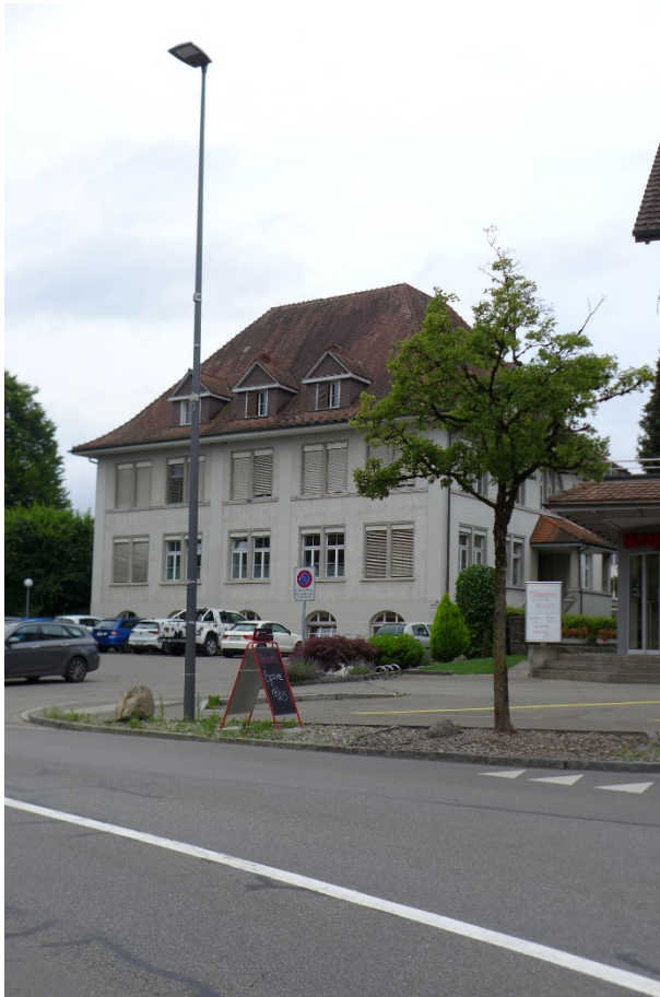
Abbildung 8 Ehem. Schulhaus, heute Gemeindehaus Niederwil. Ansicht von Nordosten (Foto 28.6.2022,)

Das auf längsrechteckigem Grundriss fussende Schulhaus steht traufseitig orientiert von der Hauptstrasse um eine Haustiefe zurückversetzt prominent auf dem Hangrücken. Diese Setzung macht das Schulhaus für die vom Tal auf der Gnadenthalerstrasse Kommenden zu einem Wahrzeichen und Erkennungsmerkmal am nördlichen Ortseingang (Abb. 8). Das Schulhaus bestimmt zusammen mit der südöstlich von ihm gelegenen Kirchenbezirk und dem hoch aufragenden Turm der Pfarrkirche St. Martin (Kantonales Denkmalschutzobjekt DSI-NIW002) das Ortsbild entscheidend.