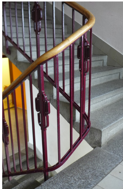
Abbildung 5 Die beiden bauzeitlichen Treppengeländer in den Schulhäusern von Neuenhof (links) und Niederwil (rechts) sind mit ihren geometrischen Jugendstilformen identisch.