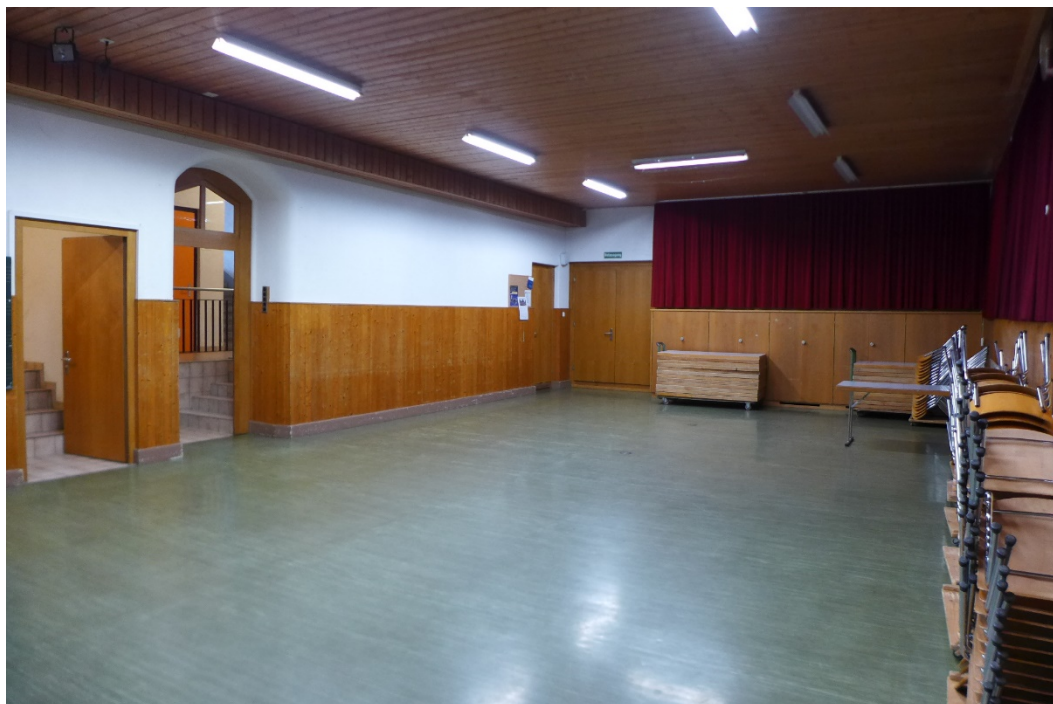
Abbildung 15 Ehem. Schulhaus, heute Gemeindehaus Niederwil. Blick in die zum Saal umgenutzte Turnhalle im Untergeschoss.