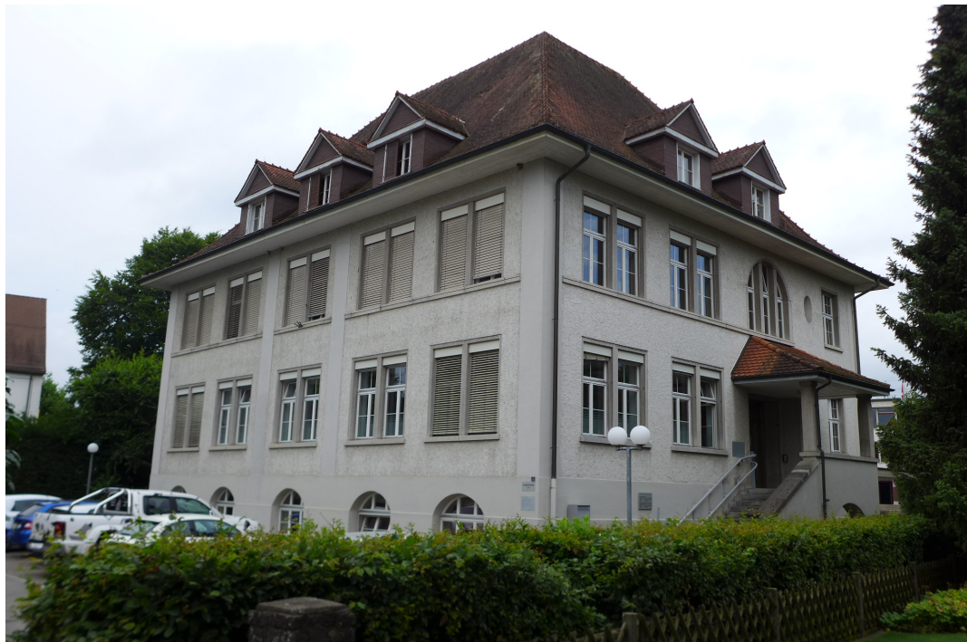
Abbildung 3 Ehem. Schulhaus, heute Gemeindehaus Niederwil. Ansicht von Nordosten (Foto 28.6.2022,)