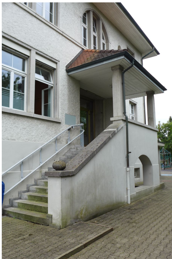
Abbildung 10 Ehem. Schulhaus, heute Gemeindehaus Niederwil. Ansicht von Nordosten. – Der Eingang ist mit Treppenmauer und von Stützen getragendem Vordach sorgfältig gestaltet und setzt einen Akzent. (Foto 28.6.2022,)