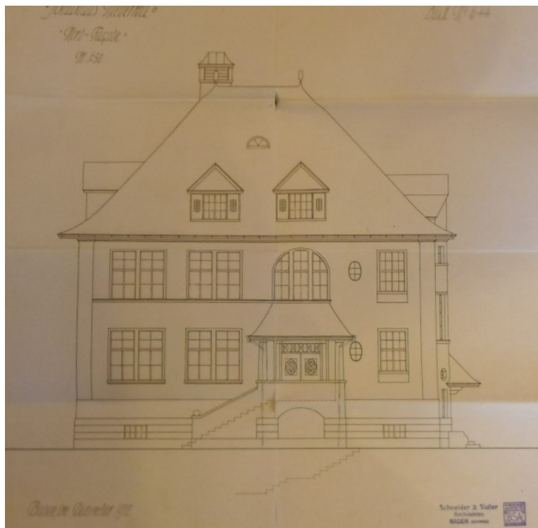
Abbildung 1 Architekturbüro Schneider & Sidler Baden. Projekt für ein Schulhaus in der Gemeinde Niederwil, Ansicht der Nordfassade, Massstab 1:50, 1910. – Das Projekt zeigt sich auf der Höhe seiner Zeit: Die vom frühen Heimatstil geforderte malerische, stimmungshafte Architektur wird mit aufgelockerten Bauvolumen, vielgestaltiger Dachlandschaft und individueller Gestaltung jeder Hausseite erreicht.