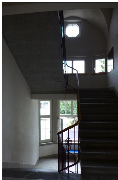
Abbildung 13 Ehem. Schulhaus, heute Gemeindehaus Niederwil. Treppenhaus an der Südwestseite. – Die abwechslungsreich gestalteten Fenster des erkerartigen Treppenhauses erzeugen eine verspielte Lichtführung im Innern. (Foto 28.6.2022,)