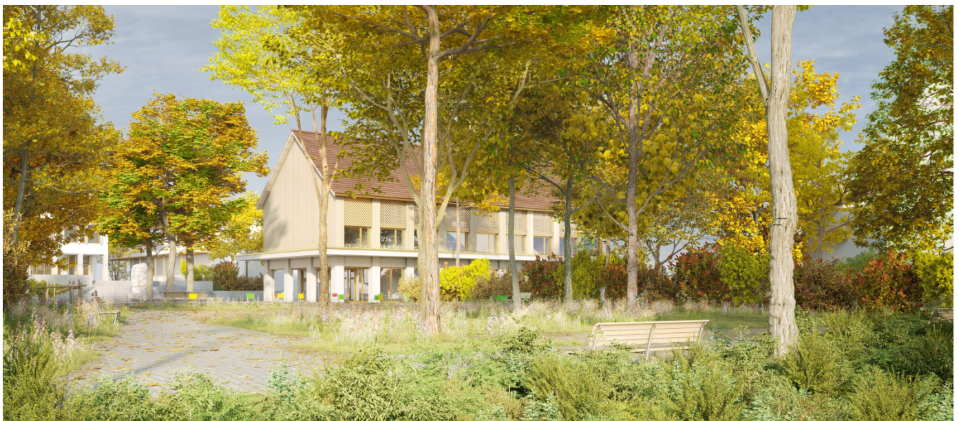
(Visualisierung Neubau Gemeindehaus; x-frame/Stoos Architekten AG)

Das Gebäude ist auf der «Peterhanswiese» angeordnet und richtet sich gegen den öffentlichen Platz. Das Projekt zeichnet sich dadurch aus, dass es das verfügbare Bauland der Gemeinde optimal nutzt. Auf der Gemeindeparzelle entsteht so ein grosszügiger Bereich in Richtung Hauptstrasse. Die Gemeinde hat hier viele Möglichkeiten für die zukünftige Entwicklung. So wäre dort zukünftig zum Beispiel auch ein Gebäude denkbar. Das ist aber nicht Bestandteil der jetzigen Planung. Es besteht die Möglichkeit, dass der Standort des FC-Clubhauses erhalten bleiben kann. Der Bau einer Tiefgarage ist möglich. Dabei erfolgt die Erschliessung ab dem Riedmattweg.