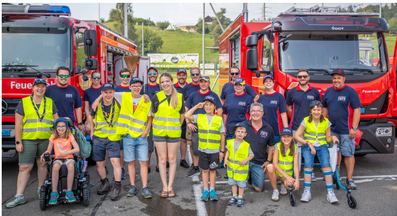
(Familientag 16.08.2025;)