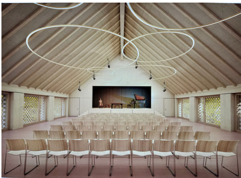
(Visualisierung Kultursaal im Dachgeschoss mit Bühne; x-frame/Stoos Architekten AG)

Gegen den Ablehnungsentscheid wurde das Referendum ergriffen. Ein Komitee hat insgesamt 480 gültige Unterschriften eingereicht. Das Referendumsbegehren wurde am obligatorischen Urnengang vom 28.09.2025 abgelehnt. Die Planung wird auf Grund der am 24.06.2025 bewilligten Kredite geführt.