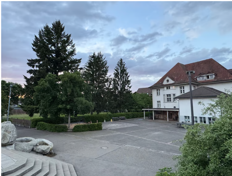
(Das alte Schulhaus mit Gemeindeverwaltung und der Bibliothek wird abgerissen, der Neubau entsteht auf der linksliegenden Peterhanswiese)

Das neue Gemeindehaus ist funktional und sehr kompakt konzipiert. Im Erdgeschoss wird die Bibliothek eingerichtet, die Gemeindeverwaltung ist eingeschossig im Obergeschoss platziert und der Kultursaal ist im Dachgeschoss integriert. Es entstehen grosszügige Aussenräume und ein schön gestalteter «Ort der Begegnung». Das neue Gemeindehaus überzeugt architektonisch als wertiger Massivbau im Kontext mit den bestehenden Gebäuden und dem gesamten Ortsbild.